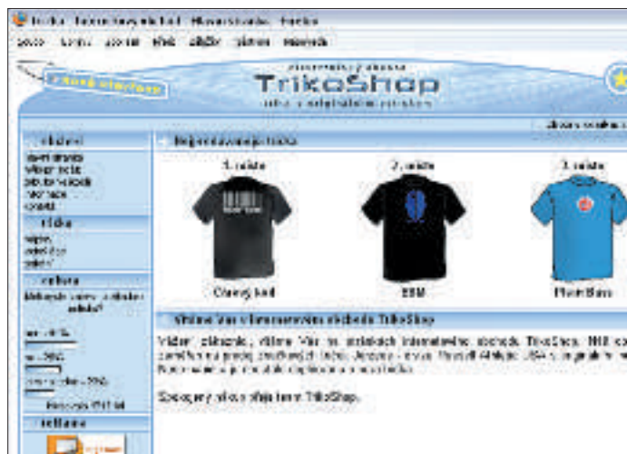
Nejhezčí a nejprehlednější titulní stránka z obchodů v tomto testu. Strohost však už není předností v případě úzké nabídky sortimentu.