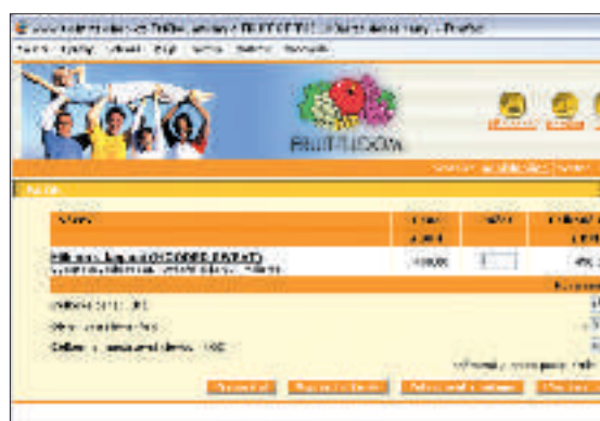
V nákupním košíku bohužel chybí konkrétní částka za balné a poštovné. Tedy alespoň do doby, než se přihlásíte ke svému účtu.