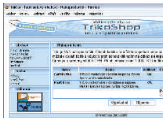
Vzorová je i podoba nákupního košíku, ve kterém je uvedena i cena za poštovné a balné. Výsledná cena je pak barevně zvýrazněna.

V reakci poměrně rychle dorazivší do naší e-mailové schránky byla pouze dosti obecná věta, že „cool“ trička s vtipným motivem si prý jistě vybereme v nabídce obchodu, kde si zboží zároveň můžeme objednat. Vzhledem k velmi omezené nabídce obchodu lze ovšem této „nic-neříkající“ větě docela dobře rozumět.