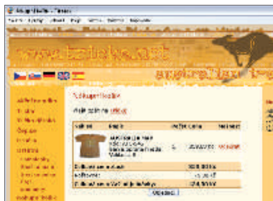
Přehledná podoba nákupního košíku nejen zrekapituluje údaje o vzoru, barvě či velikosti trička, ale přidává i informaci o výši poštovného.