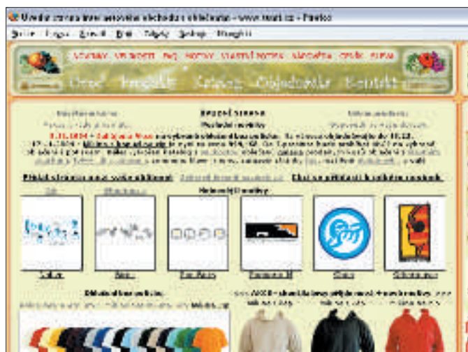
Pravděpodobně vám chvíli potrvá, než se na úvodní stránce tohoto obchodu zorientujete. Držte se horního menu.