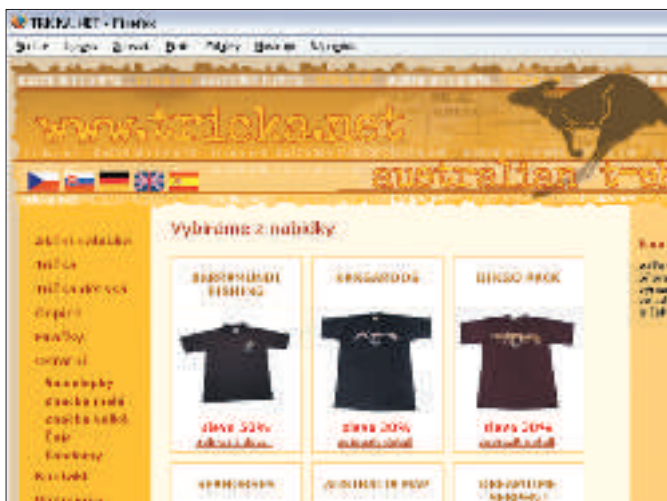
Hned na titulní stránce vám bude díky siluete klokana jasné, že zboží nabízené v tomto obchodě pochází od protozočů.

Cena za doručení nákupu je 75 Kč. To v případě, pokud využijete služeb České pošty. V případě, že doručení zboží svěříte kurýrní expresní službě, se cena zvyšuje na 150 Kč. Podle vyjádření zástupce tohoto obchodu vyřizují denně v průměru kolem pěti e-mailových dotazů. Vyřizují je prý obratem, my jsme se ale odpovědi nedočkali ani po několika dnech.