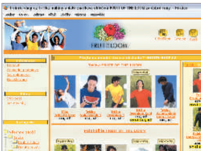
Grafická podoba stránek bohužel zůstala o několik let pozadu za vývojem webdesignu. Alespoň že horší grafika nebrání dobré orientaci.

V odpovědi na e-mailový dotaz fiktivního zákazníka jsme se hned nazítří ráno po jeho odeslání dozvěděli, že trička s potiskem se teprve připravují. V textu odpovědi byla ještě nabídka na zaslání informací o novinkách obchodu. Pro tento účel byl připojen odkaz na stránku s registračním formulářem.